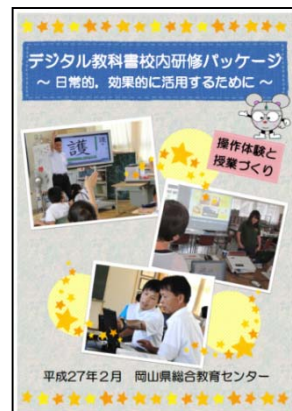
図2 校内研修パッケージのリーフレット

この夏，校内研修パッケージや研修講座を通して，指導者用デジタル教科書を体験してみませんか。