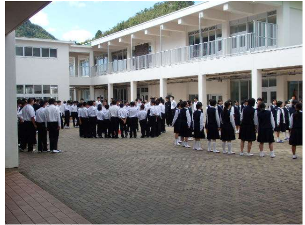
《 給食準備中の時間を利用して，3年生を中心にしてパート練習をする様子 》